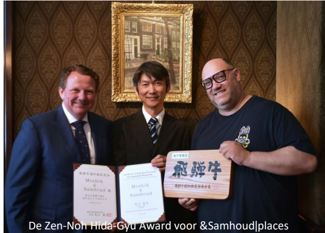
De Zen-Noh Hida-Gyu Award voor &Samhoud|places