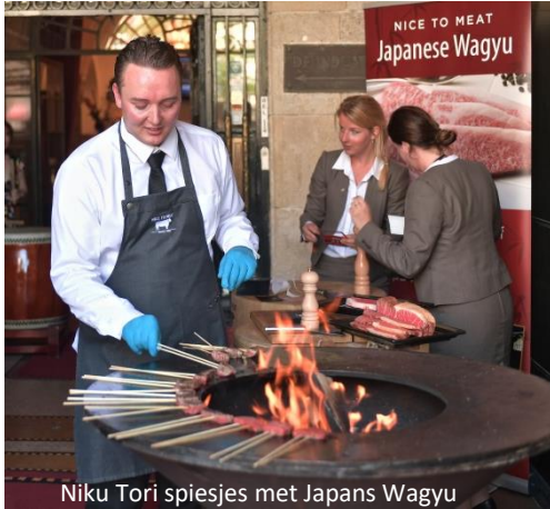
Niku Tori spiesjes met Japans Wagyu