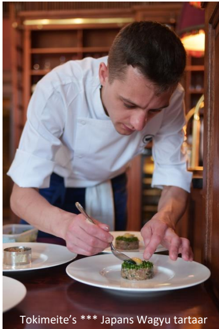
Tokimeite's *** Japans Wagyu tartaar