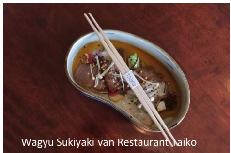
Wagyu Suki-yaki van Restaurant Taiko